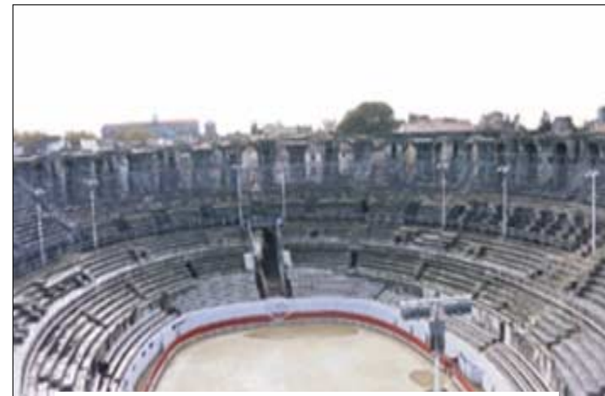
Vues de la tour